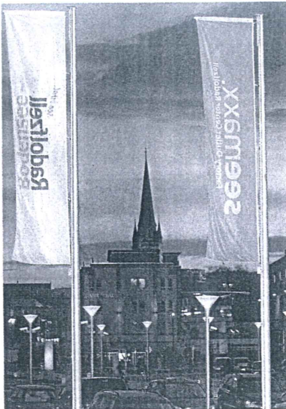
Radolfzell zeigt Flagge im Städtewettbewerb: Dem „seemaxx“ kommt dabei ab heute eine besondere Bedeutung zu.