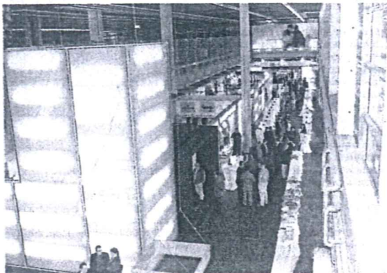
Das Urteil der Festredner bei der gestrigen Eröffnung des „seemaxx“ fiel deutlich

@ Bilder im Internet unter www.suedkurier.de